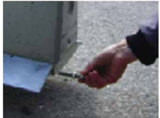
Bultarna förs in vid lossningen

När elementen placeras ut förs den patenterade kopplingen in i stålkärnan. Närmast basen kan elementen riktas in mot varandra med hjälp av en stålstång. Innan elementet sätts ned helt är det viktigt att sträcka elementkedjan något.