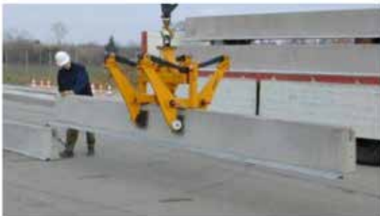
Montering med gripare för skyddsbarriärer

För hantering av DELTABLOC®-elementen används en gripare för skyddsbarriärer av betong tillsammans med en kran eller gaffeltruck.