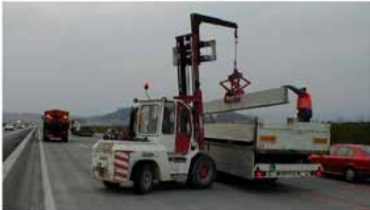
Lossning med gaffeltruck

Elementen levereras vanligtvis till arbetsplatsen med lämpliga lastfordon. En gaffeltruck eller kran kan användas för att lossa barriärerna.