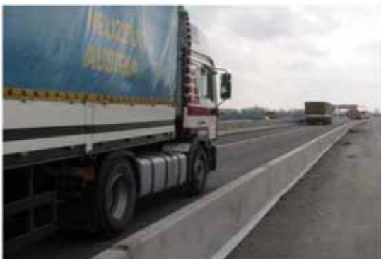
Skydd av en arbetsplats – kapacitetsklass H1

Man kan montera 2 000 m DB 65S med 3 anställda och en kranförare/truckförare på en dag (8 tim).