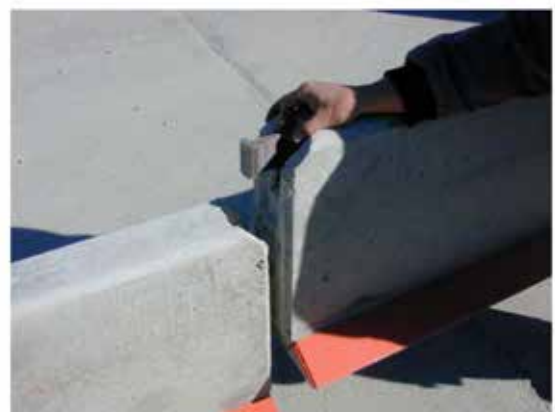
Elementet sänks ned och sätts ihop med den patenterade kopplingen

När elementen placeras ut förs den patenterade kopplingen in i stålkärnan. Närmast basen kan elementen riktas in mot varandra med hjälp av en stålstång. Innan elementet sätts ned helt är det viktigt att sträcka elementkedjan något.